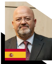
DR. NICOLÁS MANITO L. JUE 5 | THU 5TH 14:00 - 14:40 VIE 6 | FRI 6TH 18:30 - 18:50