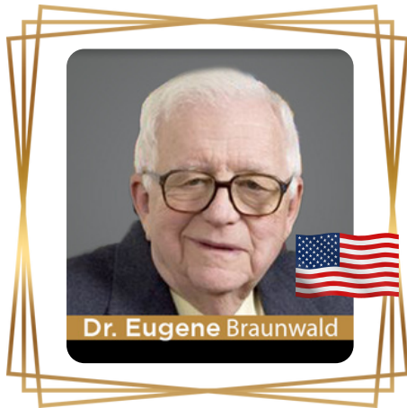
Dr. Eugene Braunwald